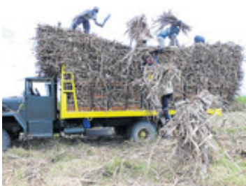
公共事業道路省は農作物などを運ぶトラックの積載制限を暫定的に撤廃した=フィリピン(インクワイラー)