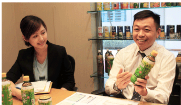
ポッカのオン取締役(右)は市場開拓に自信を示す

甘い味が好まれ、低糖や無糖の緑茶飲料の市場規模が非常に小さいと見られている東南アジアで、変化の兆しが見えている。経済発展に伴って人々の健康志向が高まっていることから、日本の無糖緑茶飲料の拡販に取り組む動きが出始めている。時代の一步先をいく取り組みを追った。